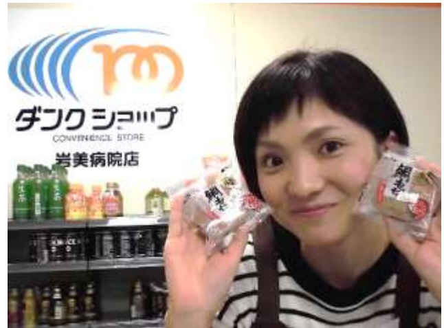
人気 No.1、鯛もちはレジ横にありますよ