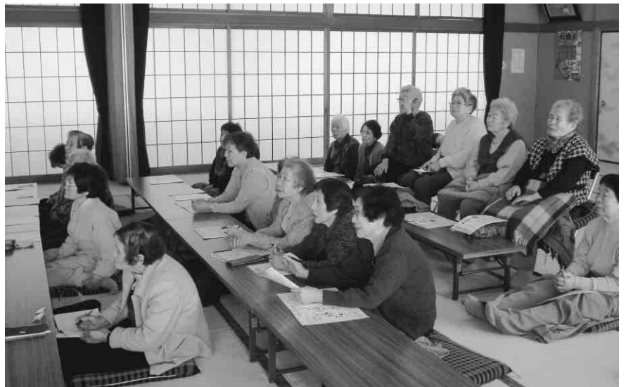
岩井ゆかむりサロンの皆さん

岩美病院では、町民の皆さんの健康を支援するため、地域の集まりや行事などに出かけていき、健康相談などを行っています。医師を始め、薬剤師、理学療法士、栄養士、社会福祉士、臨床心理士など多くの医療スタッフで対応します。希望される団体等は、お気軽に病院までお問い合わせください。