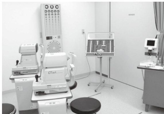
眼科診察室の様子。左手に見えるのは、(奥)視力を測る装置、(手前)眼圧を測る装置です。